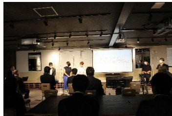
ディスカッションの様子 2