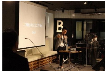
田口氏ご講演の様子 2

「fabbit 宗像」のオープニングセレモニーと同時開催された令和 2 年度第 1 回宗像ビジネス交流会「むな BIZ」は、オンライン配信という新しい形での開催となりましたが、平日にも関わらず全国から多数のアクセスを頂き、アンケート結果からも改めてウィズコロナにおける「働き方の多様性」について関心の高さを感じました。