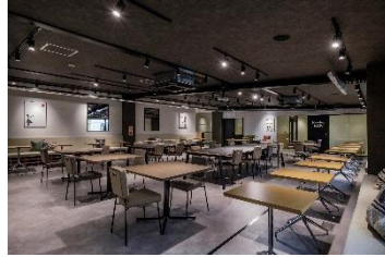
会場：fabbit 宗像 2

「fabbit 宗像」・・・JR 赤間駅南口第2自転車等駐車場2階活用事業として、赤間駅前にオープンした、コワーキングスペース等を備えた施設。宗像市、宗像市商工会、および fabbit にて「創業支援事業に関する連携協定」を締結し、宗像市発の地方創生実現を目指している。