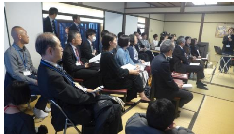
市内事業者のご紹介(國房オーナー)2

講演全体を通して講師の皆様の子育てや家庭との両立に関する考え方は参加者の皆様の共感を呼んでおりました！