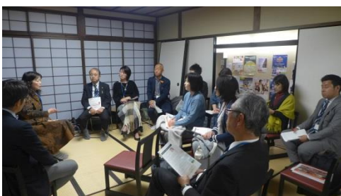
グループワークの様子1

お子様の教育についてや、ご自身の事業にかける熱意など、先輩事業者と直接お話が出来たので参考にされた方も多かったと思います。私自身も仕事に取り組む姿勢として、良いアドバイス頂けたと思っていましたが、参加された方々はいかがだったでしょうか。