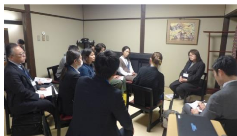
グループワークの様子2