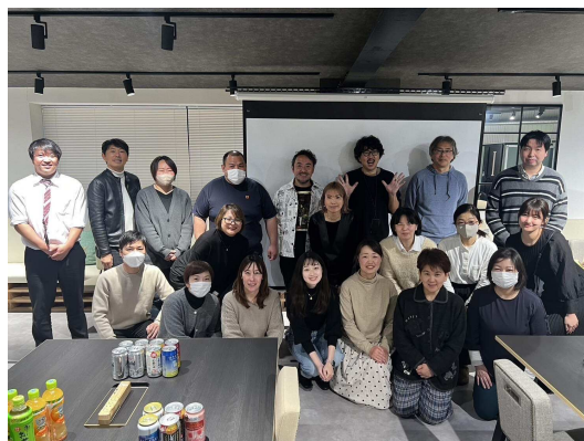
講師・参加集合写真