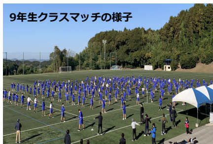
9年生クラスマッチの様子 令和4年11月28日 グローバルアリーナにて