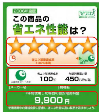
統一省エネラベル