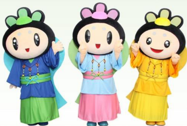
宗像市商工会のキャラクター「キラリ姫」