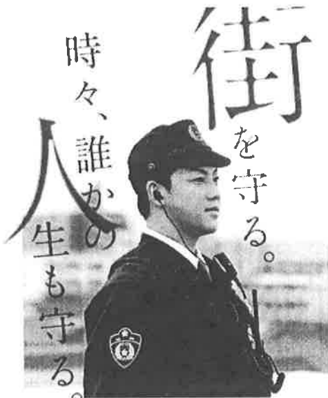
福岡県警察官募集 2022