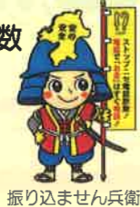
振り込ません兵衛