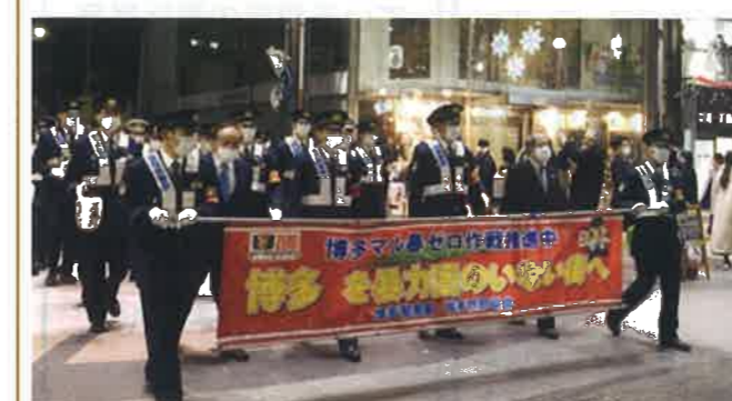
博多警察署・博多防犯協会

昨年12月、福岡県内で刑法犯1,963件(1日当たり約63件)が発生しています。