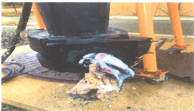
異物が絡まったポンプ