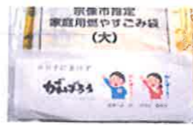
宗像市指定 家庭用お米(大)

十一月に引き続き第二回となる「コミュニティ役員・自治会長合同研修会」は、新型コロナの影響で、川北氏は東京から、市役所会場と各地区コミュニティのサテライト会場をつないで、Zoomによるオンライン研修となりました。 赤間西地区からの発表は、コミュニティ役員・自治会長合同研修会「子ども110番の家駆け込み訓練」 ①駆け込み訓練実施までの学校側・コミュニティ側の苦労や工夫 ②実施へ向けて感染予防等、入念な打合せ