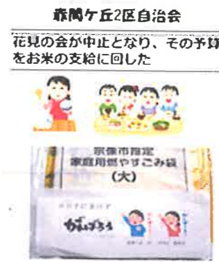
赤間ヶ丘2区自治会 花見の会が中止となり、その予算をお米の支給に回した

①花見中止の予算で、小中学生をもつ世帯に5kgのお米を支給 ②行事の仮想体験(エア行事)により役員引継ぎ