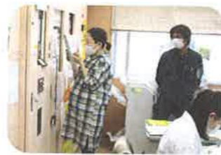
一斉放送で火災発生をお知らせ

コミセンでは定期的に消火避難訓練をしています。 調理室から出火した！！との想定の下、初期消火・ 館内放送・消防署への通報・避難誘導。 水消火器による消火訓練も行いました。