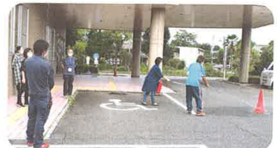
水消火器での消火訓練