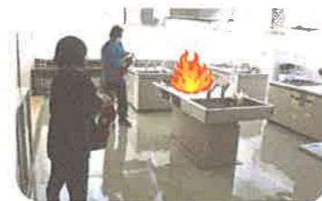
消火器で初期消火