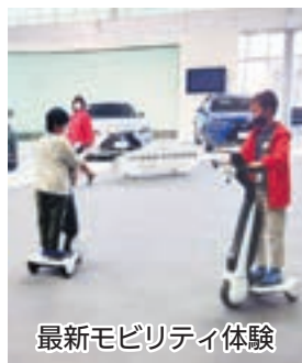
最新モビリティ体験

授業を通じて「ゼロカーボン」への理解を深め、身近にできることから実践し、そして将来「ゼロカーボン」実現の一翼を担うような“夢”を描くきっかけになりました。