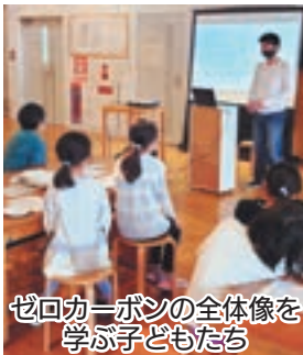
ゼロカーボンの全体像を学ぶ子どもたち