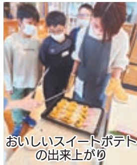
おいしいスイートポテトの出来上がり