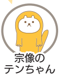
宗像の テンちゃん