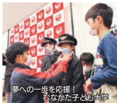
夢への一歩を応援！ むなかた子ども大学

市町。合併は多くの方が、よりよい未来のために、長い年月をかけて尽力し、ようやく実現したものでした。みなさんが希望あふれる未来を自ら切り拓き、次の世代を担う人財になってくれることを期待しています。