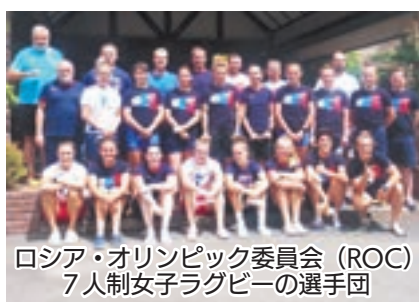
ロシア・オリンピック委員会(ROC) 7人制女子ラグビーの選手団