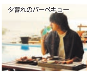
夕暮れのバーベキュー