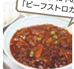
博多和牛の「ビーフストロガノフ」