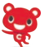
CO・OP共済キャラクター「コーすけ」

申 ①郵便番号・住所 ②代表者氏名 ③年齢 ④電話番号 ⑤参加人数 ⑥エフコープ組合員は組合員番号を明記して▶ハガキ(〒810-0001/福岡市中央区天神1-4-1/西日本新聞イベントサービス内「コーすけウォーキング宗像」事務局あて)▶WEB受付(右記コード参照) 問 西日本新聞イベントサービス内「コーすけウォーキング」事務局 ☎092(711)5491