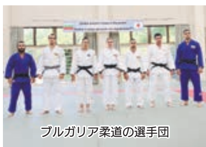
ブルガリア柔道の選手団