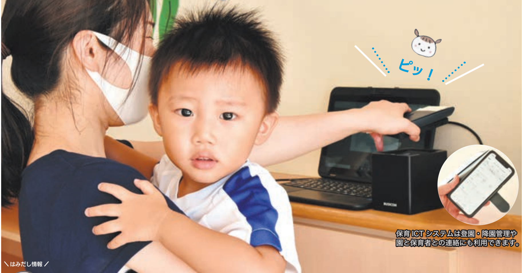
保育ICTシステムは登園・降園管理や園と保育者との連絡にも利用できます。

● 保育ICTの導入で、保護者の利便性向上+ 保育園・保育士の業務軽減=安全・安心・保育の質の向上