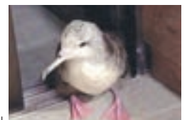
市の鳥 「オオミズナギドリ」

むなかたタウンプレスは、常用漢字と新聞用字用語集を基本に、市独自の用字用語を定めて編集しています。また、市民のみなさんの居住地は、コミュニティ地区名で表記しています。