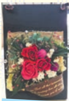
フラワースタンド