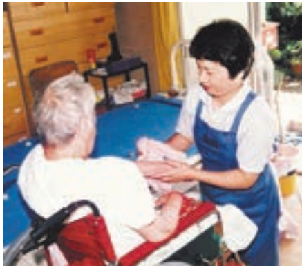
優しく高齢者を介護する 社協ホームヘルパー

本会「社協ホームヘルパー」は、介護保険制度が実施される以前の「在宅福祉」の時代から「家庭奉仕員」として、在宅での介護を支えてきました。1974(昭和49)年に宗像市の委託事業「老人家庭奉仕員派遣事業」受託開始から、今年で47年目を迎えました。 ホームヘルパーは、高齢者や障がいのある人で、日々の生活を送るのに不自由がある人たちの住まいを定期的に訪問し、さまざまな介護や生活の援助をしています。仕事内容は、介護が必要な人への食事や入浴、トイレ(排泄)などの支援。また、家事が困難な人に対しては、掃除や洗濯、買い物や調理などの家事支援をしています。 2000(平成12)年の介護保険法の施行にともない「社協ホームヘルパー」は、従前の「社協ホームヘルパー」として活動する「指定訪問介護事業所」と、新たに介護支援専門員(ケアマネジャー)が居宅介護サービス計画(ケアプラン)の作成等を実施する「指定居宅介護支援事業所」の指定を受け、公民共同体としての社会福祉法人として、介護保険制度スタート時から介護保険制度の健全な運営と成長に貢献してきました。 社協ホームヘルパーは、約50年の在宅介護の経験を活かし、今後も高齢者や障がいのある人への訪問介護事業等の充実を目指して活動を続けます。