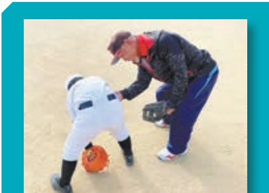
まだ入って間もない選手をマンツーマンで指導しています。

少年野球クラブ「自由ヶ丘ファイターズ」ではお孫さんの参加をきっかけに、多い日は週に4日、選手のお父さんたちに混じってクラブチーム運営のお手伝いをしています。今では3人のお孫さんが所属しており、ジャージ姿にグローブをはめて櫛を飛ばしています。試合後の監督や保護者との反省会も楽しみのひとつですが、クラブチームの子どもたちの成長をみるのもやりがいになります。