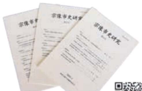
新修市史編さんの調査や研究の成果が記述されている「宗像市史研究」市史には右記コードから。