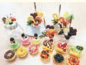
メモクリップ作り