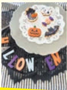
アイシングクッキー