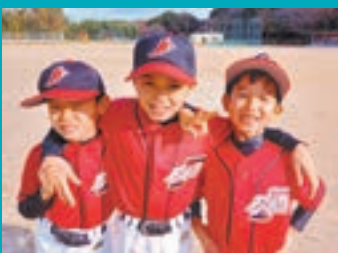
自由ヶ丘ファイターズの3人のお孫さん

少年野球クラブ「自由ヶ丘ファイターズ」ではお孫さんの参加をきっかけに、多い日は週に4日、選手のお父さんたちに混じってクラブチーム運営のお手伝いをしています。今では3人のお孫さんが所属しており、ジャージ姿にグローブをはめて櫛を飛ばしています。試合後の監督や保護者との反省会も楽しみのひとつですが、クラブチームの子どもたちの成長をみるのもやりがいになります。