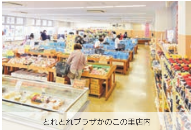
とれとれプラザかのこの里店内

「宗像育ちの野菜を子どもたちに食べてもらおう」と、宗像農業協同組合や県農業普及所、市農業振興課・教育委員会などの助言を受け事業計画を練りました。スタート当時は、学校給食担当の栄養教諭らと生産者との頻りに話を重ね、無理をしない継続できる方法をと模索しました。その結果、たどり着いたのが今の仕組みです。