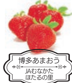
博多あまおう JAむなかた ほたるの里