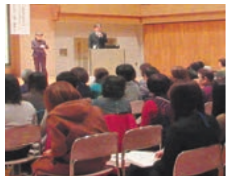
ゲートキーパーについての講演を熱心に聞き入る参加者たち

「こころの病気は、誰にでも起こりうる。こころの不調が積み重ならないよう、悩んでいる人に気づき、声をかけ、話を聞いてあげることのできるゲートキーパーの支援が必要」と講師。参加者からは「家族や友人が悩みを抱えているとき、適切な対応ができるように、学んだことを生かしたい」などの感想があり、ゲートキーパーの重要性を学ぶ一日となりました。