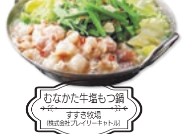
むなかた牛塩もつ鍋 すずき牧場 (株式会社プレイリーキャトル)