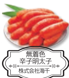
無着色 辛子明太子 株式会社海干