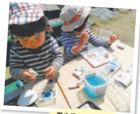
石や貝殻に夢中で色を塗っていきます

制作遊びが好きなわが子は、粘土や折り紙、ぬり絵などを楽しんでいます。天気の良い日には、段ボールを庭に敷いて石や貝殻にペイント遊び。ちょっと場所を変えるだけで子どもにとっては新鮮だった様子。こんな時こそ新しい視点で上手に息抜きをしながら、家族や自分のために楽しい時間を作りたいですね。(ママレポーター・徳永) * 子育て中のレポーターが取材したさまざまな記事は、市HP→「むむハグ。」→「ママ・パパレポート」で見ることができます