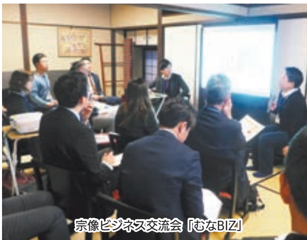
宗像ビジネス交流会「むなBIZ」