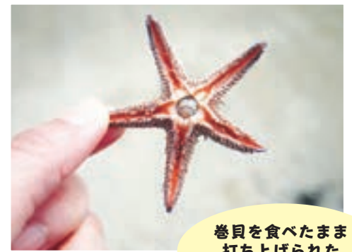
巻貝を食べたまま 打ち上げられた ヒトデを発見

* 子育て中のレポーターが取材したさまざまな記事は、市HP→「むむハグ。」→「イベントレポート」で見ることができます