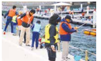
防波堤釣りの様子

うみんぐ大島10周年を記念して、誕生祭・安全大漁祈願祭を開催します。暖かい日差しの中、釣り体験や稚魚放流、お楽しみ抽選会などが盛りだくさん。釣り体験の釣竿・エサは先着100人に無料で貸し出します。ぜひ、家族や友人と一緒に参加してください。