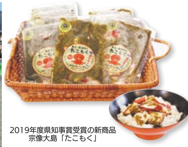
2019年度県知事賞受賞の新商品 宗像大島「たこもく」