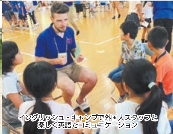
イングリッシュ・キャンプで外国人スタッフと 楽しく英語でコミュニケーション