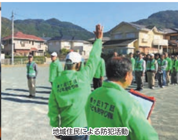
地域住民による防犯活動