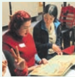
地図を使って交流