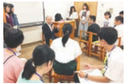
明石元国連事務次長とのディスカッション

地方自治体・経済界・学界が一体となって開催する「日本の次世代リーダー養成塾」。マレーシア第4代・7代首相のマハティール氏をはじめ、各界で活躍する講師陣の講義や高校生同士でのディスカッションなどを通じて、日本だけでなく世界を舞台に挑戦する人材の育成を目指します。