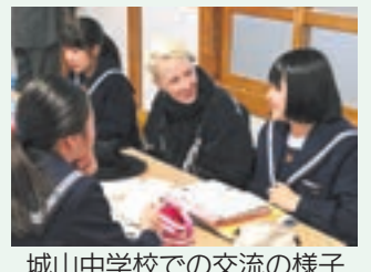
城山中学校での交流の様子

(Munakata City is looking for International Volunteers who can help us promote cultural exchange activities. For more information, please contact us at 0940- 36-1214.)