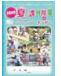
2019年度 ガイドブック

市立学校の夏休み期間中に市内で実施される子ども向けのイベントを、ガイドブック「2020夏の課外授業 in むなかた」で紹介します。夏休み期間中に多彩な体験を市内で提供する事業者を募集。説明会を開催しますので、関心のある事業者はぜひ参加してください。