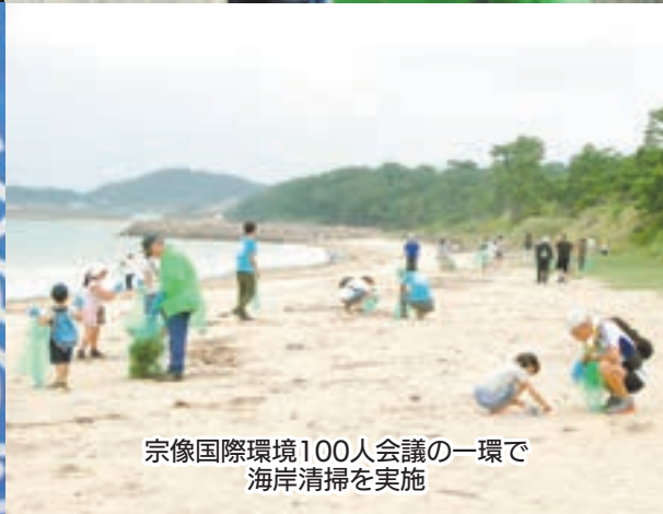
宗像国際環境100人会議の一環で 海岸清掃を実施