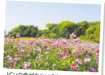
ピンク色がかわいらしいレンゲソウ

田んぼや畑の近くで見られるレンゲソウ。見かけると懐かしい気分になる方もいるのではないのでしょうか。この時期、田熊地区では綺麗なレンゲソウ畑が広がっています。自然に育つ雑草というイメージが強いですが、実は空気中の窒素を植物の栄養に変える働きがあり、農家の人がわざわざ種をまくのだそうです。素朴な春を感じさせてくれるレンゲソウ、近くを通ったときなど、ぜひ見てください。