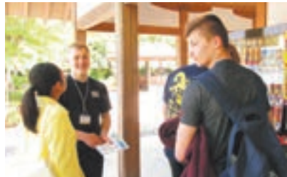
選手たちと楽しく交流