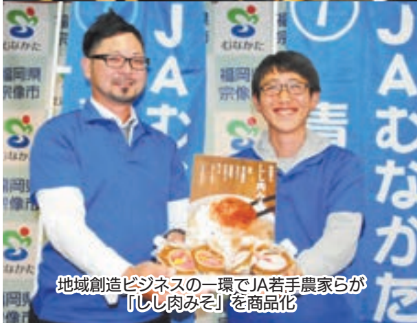
地域創造ビジネスの一環でJA若手農家らが 「しし肉みそ」を商品化