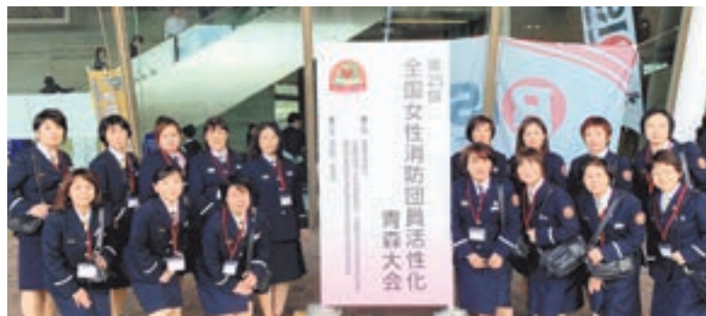
大会に参加した女性消防班

パワフルな防火劇や、防災活動の発表を見て、仕事や家庭を持ちながらさまざまなことに挑戦する全国の仲間にも勇気づけられました。吸収できる表現方法の発見が多くあり、とても刺激を受けました。私たちが負けじと、さらにわかりやすく心に残る啓発活動を目指して頑張るぞと、心に誓った大会でした。一緒に女性消防班活動をしてくれる人も募集しています。ぜひ問い合わせください！ ☎地域安全課 ☎(36)5050