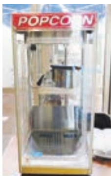
購入したポップコーンメーカー

玄海地区コミュニティ運営協議会では、宝くじの助成金を活用し、展示用パネルとポップコーンメーカーを購入しました。この助成金は、宝くじの社会貢献広報事業として、(一財)自治総合センターが宝くじの受託事業収入を財源に実施しているコミュニティ助成事業です。購入した機材は、地域のまつりなどに活用されます。