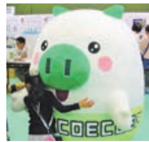
県の広報部長エコトン

昨年11月23日、「豊かな自然と歴史の宗像、守り・育て・活かす」をテーマにメイトム宗像で開催しました。市民団体や各地区コミュニティ運営協議会、市、県、企業など約40団体が参加し、当日は約2,100人の来場客でにぎわいました。出展ブースではエコ工作や団体・企業の活動報告、ステージでは東郷小学校や宗像国際育成プログラムなど、子どもたちの発表も行われました。