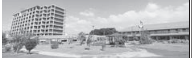
敷地所有: (株)キューヘン

住所/〒811-3214 福岡県福津市花見が丘3丁目28番2号 ホームページを更新しました。九電ケアタウン 検索