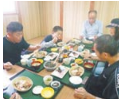
じのしま漁師膳に舌鼓

参加者は、新鮮なカンパチなどの刺し身とカワハギの煮付けを主とした「じのしま漁師膳」に舌鼓を打っていました。