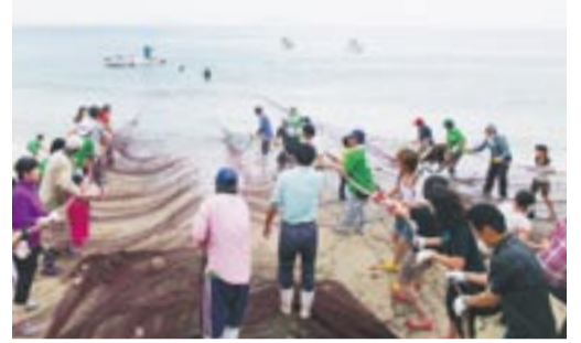
みんなで力を合わせた地引網

地引網の後は、グループごとに分かれて「しちりん」でのバーベキュー。イカやサザエなどの新鮮な地島の海産物に、参加者も大喜びでした。