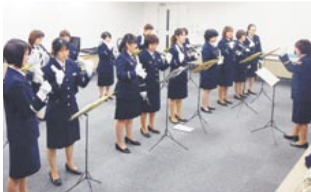
日々練習を重ねているクワイアチャイムの演奏