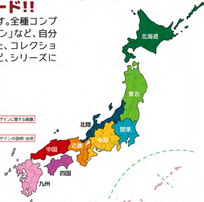
表面はマンホール蓋の写真と設置されている座標軸、ピクトグラムが入ります。裏面にはデザインの由来やモチーフ、下水道についての情報等を記載します。カードベースの色を日本を北海道、東北、関東、北陸、中部、近畿、中国、四国、九州の9つの地域で色分けしています。