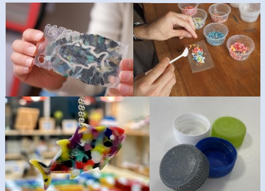
ペットボトルキャップをリサイクル!