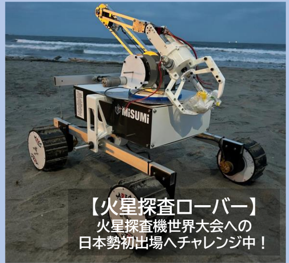
【火星探査ローバー】 火星探査機世界大会への 日本勢初出場へチャレンジ中!