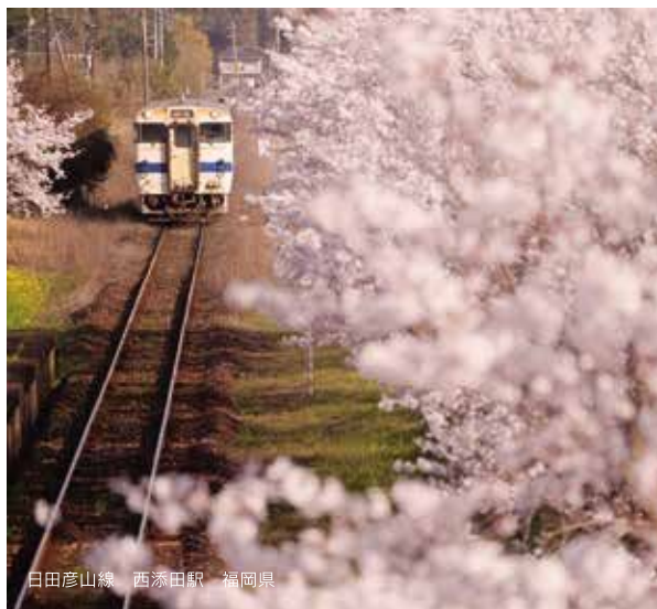
日田彦山線 西添田駅 福岡県