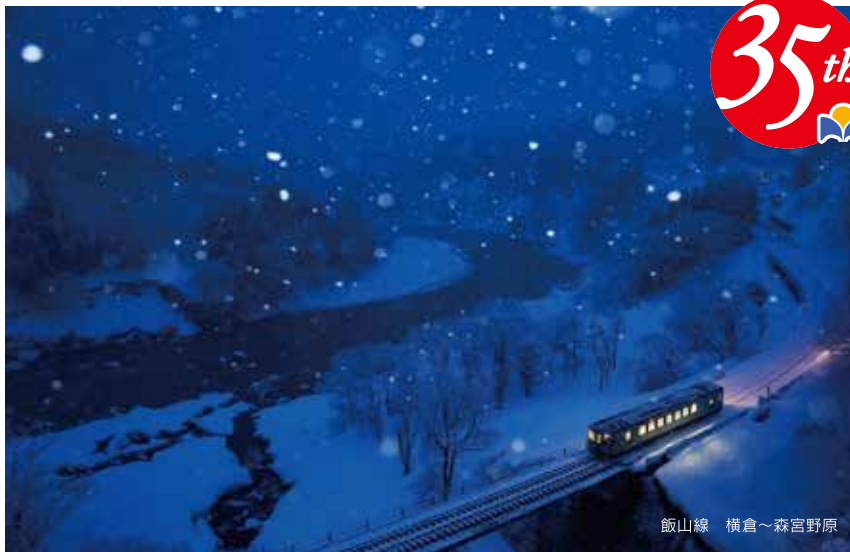
飯山線 横倉～森宮野原