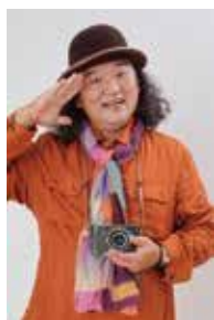
鉄道写真家 中井 精也