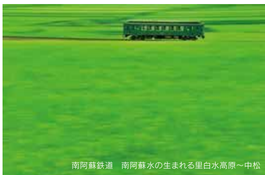
南阿蘇鉄道 南阿蘇水の生まれる里白水高原～中松

2022年7月に開催され、好評を博した「宗像小鉄道展」が2023年12月鉄道会社の協力のもと、さらにパワーアップして「むなかた大鉄道展」として開催されます。ゲストに鉄道写真家・中井精也氏をお迎えし、講演など鉄道に関するさまざまな展示や催しをどうぞお楽しみください。