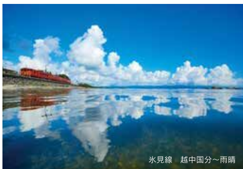
水見線 越中国分～雨晴