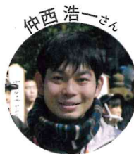
NPO 法人 メイクハッピー&ピース 代表