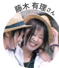
パパママ応援・ ネットワークいろり 副代表