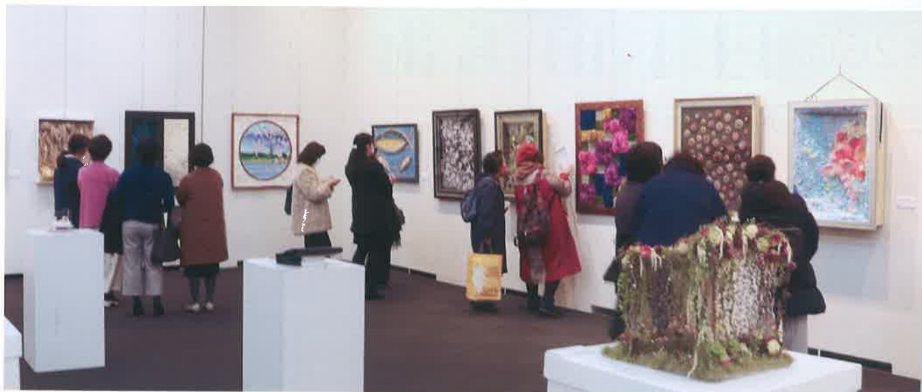
多くのお客様がご来場