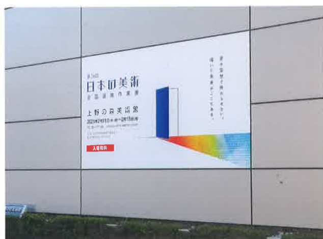
巨大な壁面バナーでお客様をお出迎え