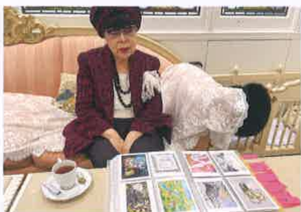
ブライダルファッションデザイナー 桂由美氏