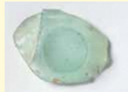
国宝 カットガラス碗片 サーサーン朝ペルシア由来のガラス製容器の破片。浮き出しの円いカットが特徴。