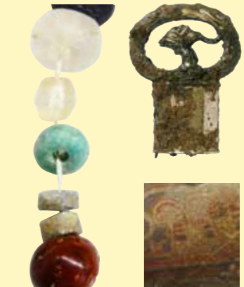
皆見大塚古墳の 単環頭柄頭飾 皆見大塚古墳(みやこ町)で見つかった、大刀の柄頭に装着された金銅製の飾り金具です。中央に鳳凰の頭部がかたどられています。

かつて福岡の地には「筑紫君」や「宗像君」といった古代豪族が独自の勢力を築いていました。その姿は、彼らが残した古墳や、そこから発掘された出土品によってうかがい知ることができます。本企画展では、福岡で活躍した古代豪族の姿を出土品から解き明かします。