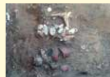
浜宮貝塚遺物出土状況 アワビの貝がらやタイ・フグの骨、土器などが出土。古代の海人たちは、現代人よりグルメかも。