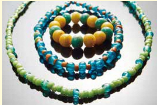
国宝 ガラス製玉類 眩いばかりの煌めきで古代から人々を魅了し続けた色とりどりの小玉。

沖ノ島の国家祭祀でささげられた約8万点の絢爛豪華な奉獻品は国宝、沖ノ島神宝として知られています。この神宝は古代の人々の美意識を体現しており、美の骨頂とも言えるものです。本展では神宝の荘厳美とそこに隠された匠の技を体感していただけます。煌びやかなガラス製品の研究成果も必見です。