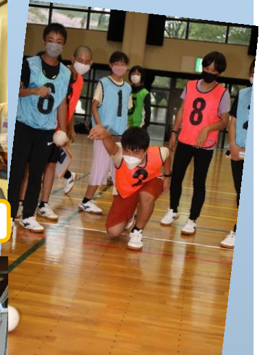
ニュースポーツ ユニカール