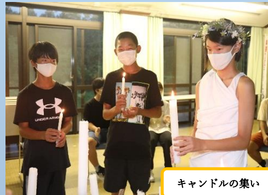
キャンドルの集い