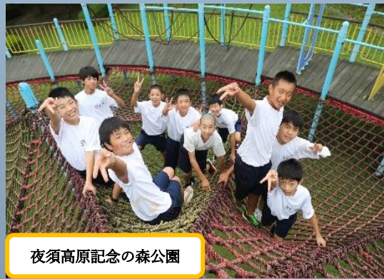
夜須高原記念の森公園