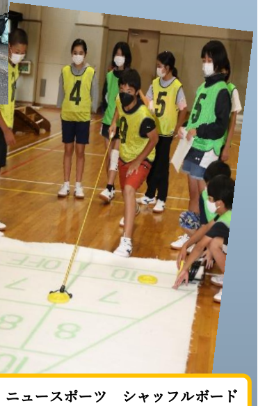
ニュースポーツ シャッフルボード

僕はこの3日間、不便な生活をして、今まであまり話さなかった人とも関わったし、家にいる楽しさを知りました。初日、僕は「ご飯をしっかりと作れるか」「テントをしっかりと立てられるか」心配だったけど、班のみんなと協力してご飯を作れたので良かったです。でも、メリハリや話を聞くことや3分前行動が最後まであまりできませんでした。だから、これからの学校生活で変えていこうと思いました。僕が、この3日間で特に楽しかったのは、草スキーと野外炊飯とニュースポーツとヤスゴンとキャンドルの集いです。最終日のヤスゴンでは、みんなで鬼ごっこができて楽しかったです。いい3日間でした。