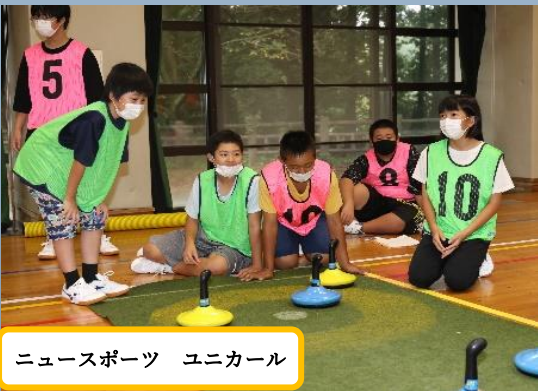
ニュースポーツ ユニカール