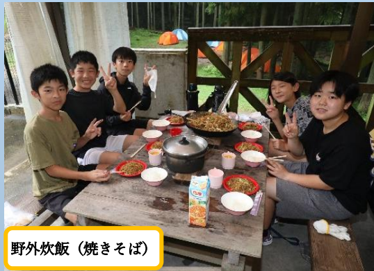
野外炊飯(焼きそば)