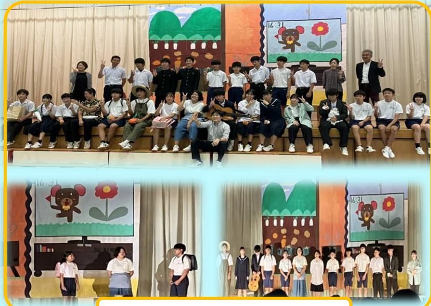
9学年劇 「開拓村のかあさんへ」