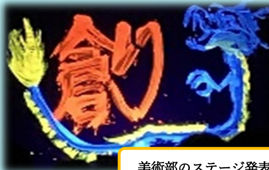
美術部のステージ発表