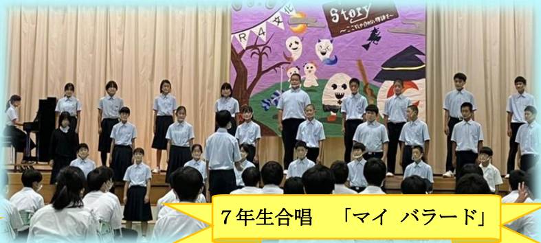
7年生合唱 「マイ バラード」