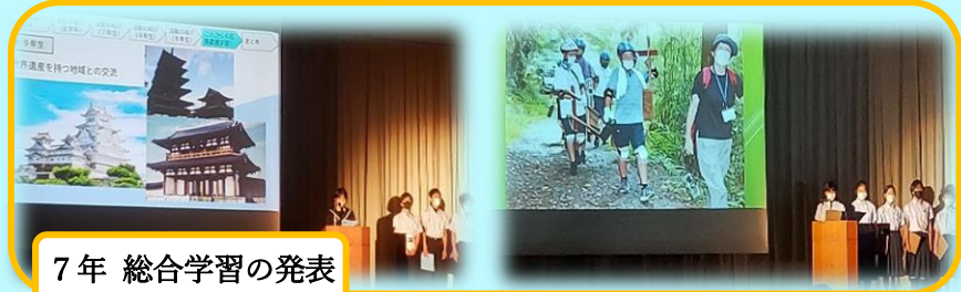
7年 総合学習の発表