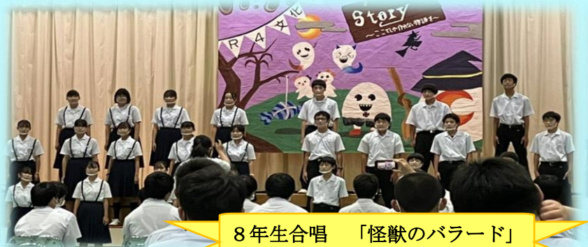
8年生合唱 「怪獣のバラード」