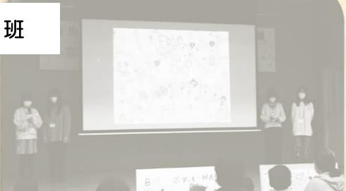
ポアッキーマップ紹介