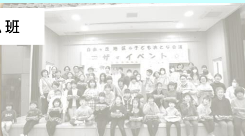
自由ヶ丘の花マリーゴールドの種植え