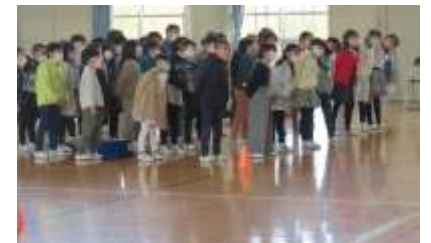
1年生 寸劇と歌のプレゼント