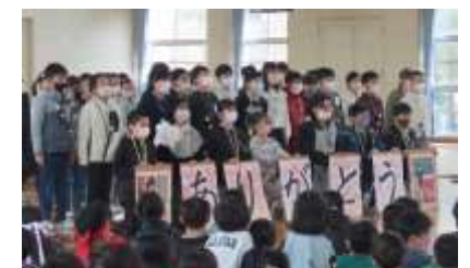
4年生 呼びかけとリコーダー