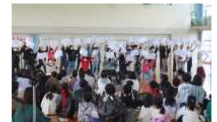
5年生 呼びかけと歌のプレゼント