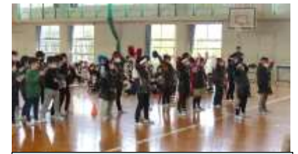
2年生 応援団からのエール