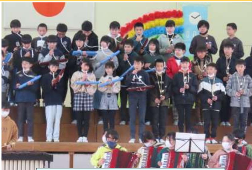
自由ヶ丘南小を支えてくれた6年生 59名です!