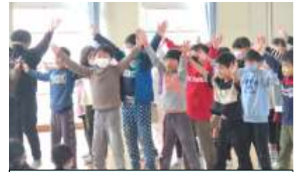
3年生 ダンスのプレゼント