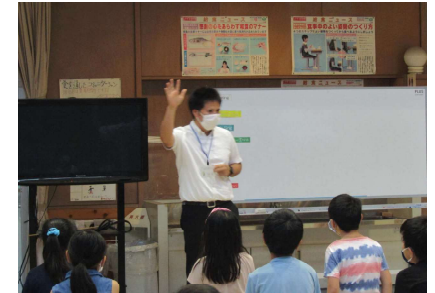
【河東西小での兼務教員による英語の授業】