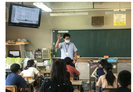
【河東小での兼務教員による英語の授業】