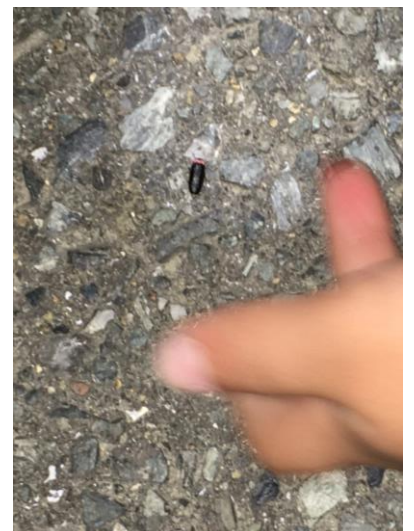
子どもの手とヒメボタル