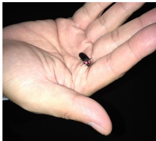
おとなの手とゲンジボタル