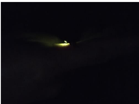
ホタルの撮影は難しい…