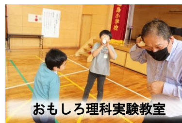
おもしろ理科実験教室