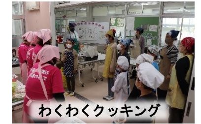
わくわくクッキング