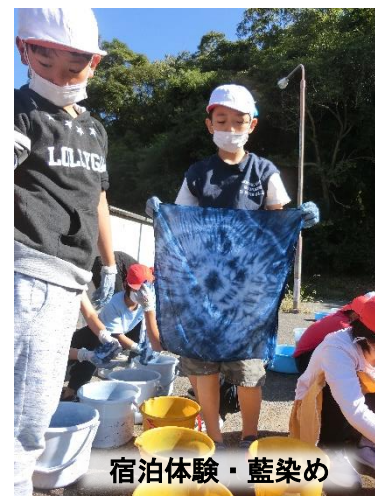
宿泊体験・藍染め