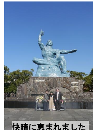
快晴に恵まれました