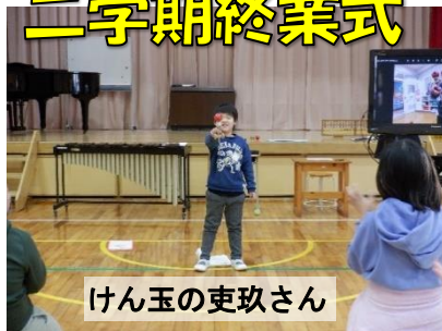
けん玉の吏玖さん