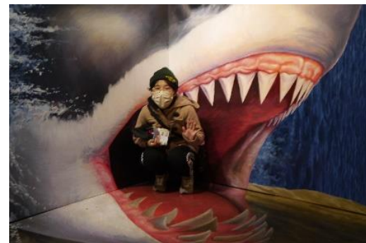
きゃ〜〜サメに食べられる! (トリック・アートの館にて)