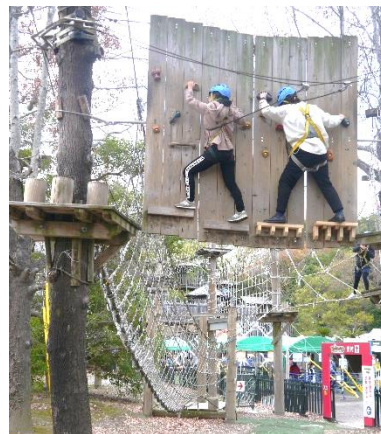
命綱1本で、アスレチックに挑戦する2人

3日目は、グラバー園などをまわりました。あっというまの3日間でした。思い出に残る旅行になりました。