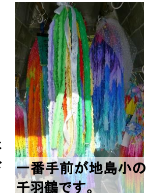
一番手前が地島小の 千羽鶴です。