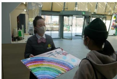
地島のみなさんにも折っていた だいた千羽鶴を資料館と平和公園 園にささげてきました。