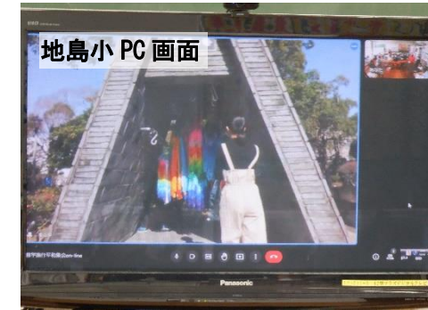
平和公園での平和集会は、オンラインで学校とつなぎ、在校生も参加しました。