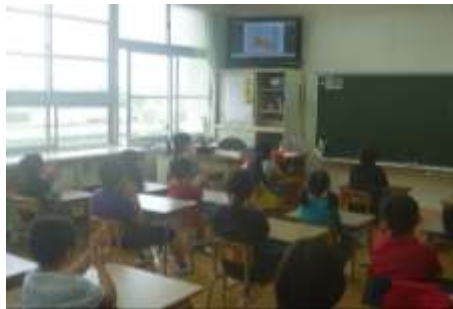
手洗い指導「あわあわ手洗いの歌」

全校で集まることができませんので、テレビ放送による全校朝会を行いました。手洗いや人とのきよりとって、自分とみんなの命を守ることの大切さを全校で確認しました。また、「あわあわ手洗いの歌」に合わせて、丁寧に手を洗う練習もしました。医療に携わっている方々や物資を運搬している方々のご努力と願いにも触れ、感謝