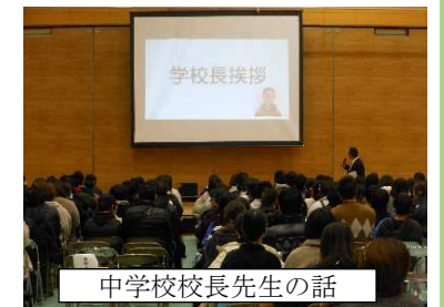
中学校校長先生の話

2月1日（木）、中央中学校の体育館で、「新入生入学説明会」が行われました。入学に向けての心構えや中学校生活の概要について説明がありました。その後、希望者は、部活動を見学しました。7年生の活動の様子を見たり体験をしたりして中学校入学への期待感が高まっていました。