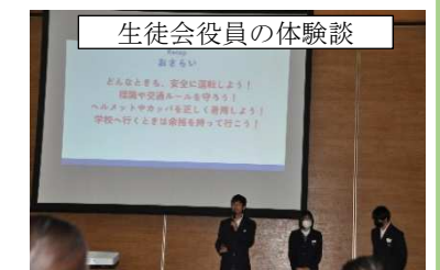
生徒会役員の体験談

宗像警察署から自転車の交通ルール、宗像サイクルさんから自転車安全点検のチェックポイント、生徒会会長・副会長から体験談を聞きました。試乗体験も行い、通学路の危険箇所を確認しながら地域の方に見守られて下校しました。たくさんの地域の方に支えられ、安心・安全な中学校生活のスタートが切れます。