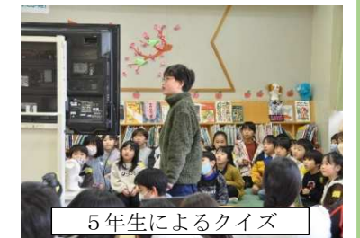
5年生によるクイズ

2月2日（金）東郷小学校で、8日（木）南郷小学校で、「新1年生入学説明会」が行われました。保護者には、小学校生活の様子や入学準備について説明がありました。東郷小では、来年度お世話をする現5年生が、入学予定児童に、ワクワク・ドキドキ感を高める「学校探検」活動を工夫し、楽しい時間を創り出しました。来入児にも5年生にもたくさんの笑顔が満ち溢れた時間でした。