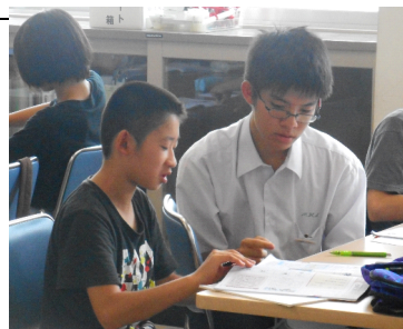
【宗像高校の生徒と一緒に学習する6年生の様子】

7月23日(火)~26日(金)の4日間、6年生で希望した59人が宗像高校での夏休み学習会へ参加しました。中央学園小中一貫教育の取組の一つとして、南郷小学校と合同です。1日2時間、夏休みの宿題の他、これまでに学習してきた内容の復習プリント等、それぞれ自分で課題を見つけて学習します。宗高生がグループに二人又は一人ついて、その指導に当たってくれました。わからないところを優しく説明してくれたり、持参した電子辞書を貸してくれたりする姿があり、一生懸命関わってくれる宗高生のおかげで、学習が効率よく進みました。また、子供たちにとっては、宗高生の素晴らしさを実感するひとときにもなりました。