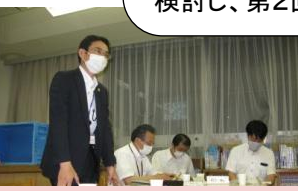
伊藤先生より指導助言