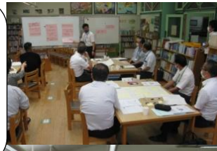
KJ法で子ども像を検討