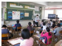
自由ヶ丘南小学校