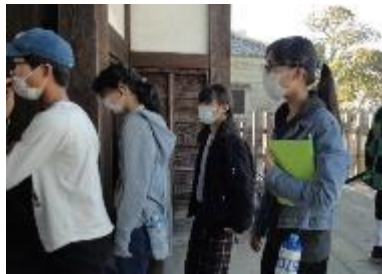
出島を見学する子ども