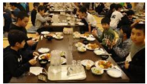
ホテルで食事をする子ども