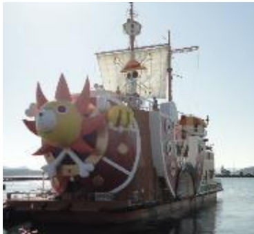
サウザンド・サニー号

昨年は雨の中の平和集会でしたが、晴天の中全校児童が作った折り鶴をささげ、平和の誓いを行いました。