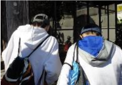
如己堂を見学する子ども

これもひとえに保護者の皆様が、無事に帰ってきてほしいと願ってくださったおかげです。