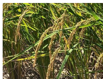
十分に熟し実った稲穂

秋と言えば、「食欲の秋」「スポーツの秋」「読書の秋」など秋の楽しみはたくさんあります。自分なりの「〇〇の秋」を見つけ、一段と成長を感じる「実り多き秋」にしていきたいと思えます。今月も、御理解・御協力の程、よろしくお願ひいたします。