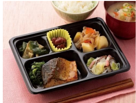
エフコープ 「コープの夕食宅配」…P2