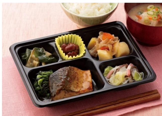
(おかずコースの献立例)