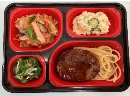
みんなのキッチンふくつ…P7