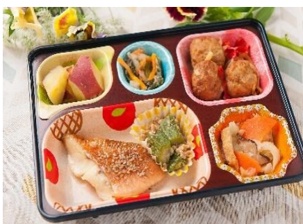
ライフデリ宗像店…P5