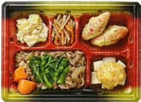
(まごころおかずの献立例)