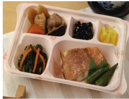
宅配クック1・2・3 宗像店…P4