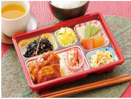
うちくる夕食 宅配サービス…P1