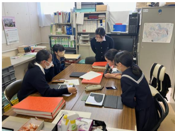
画像⑦(歴史学フォーラムに向けた調査)