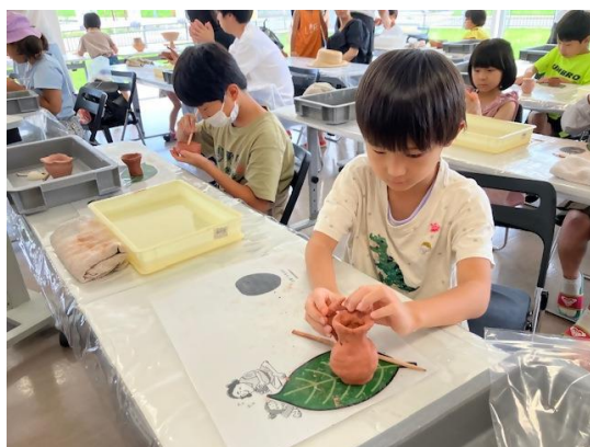
画像①(土器をつくろう)