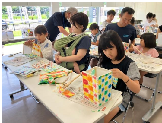
画像②(明かりの絵灯籠をつくろう)