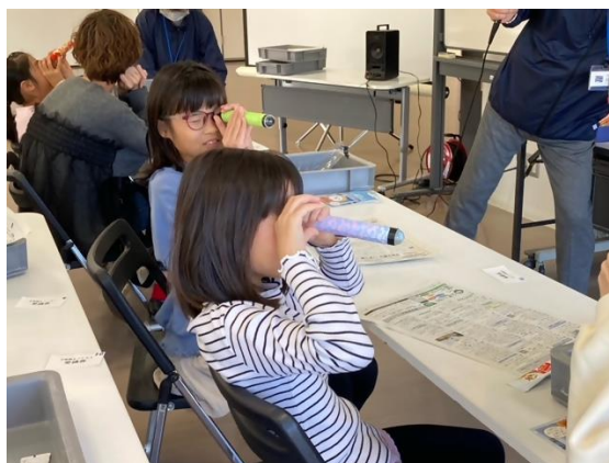
画像⑥(ビー玉で万華鏡をつくろう！)