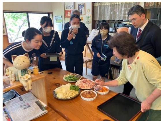
画像⑧(鶏すきの食調査)