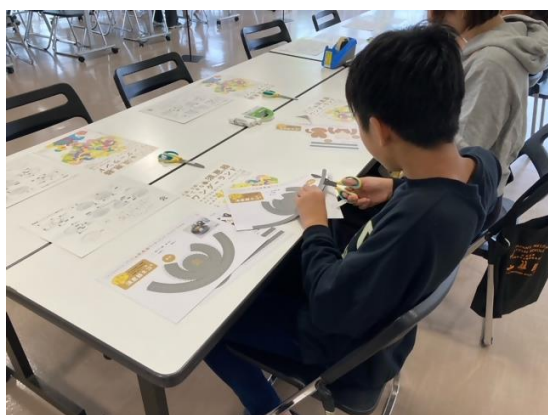
画像⑤(出張！大野城心のふるさと館 「須恵器ペーパークラフトをつくろう！」)