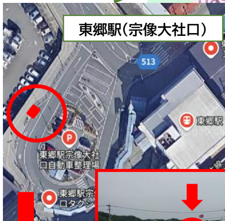
東郷駅(宗像大社口)