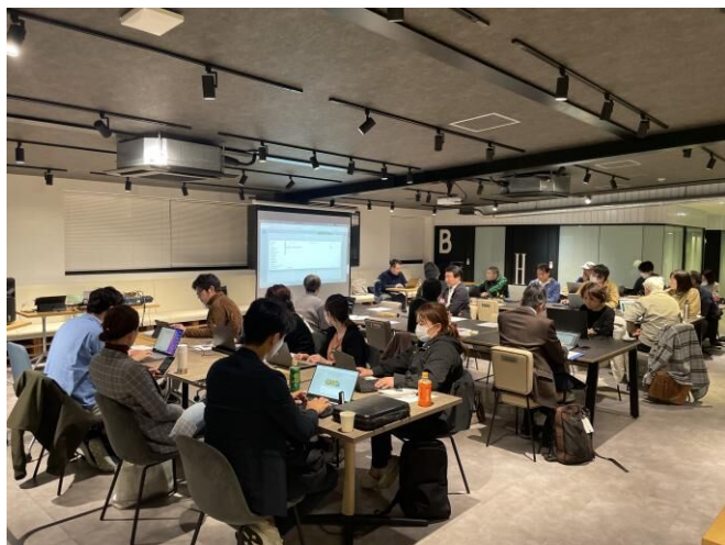
▲講義に参加された皆様

特にGeminiのルールに基づいたメール返信文の作成方法と、NotebookLMの活用についてAIが繰り返し業務やストレスの高い業務を代替することで効果的に活用することを強調しました。