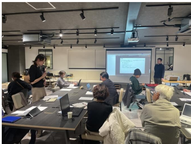
▲熱心に質問をする参加者