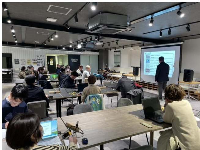
▲実際にPCを使用している講義