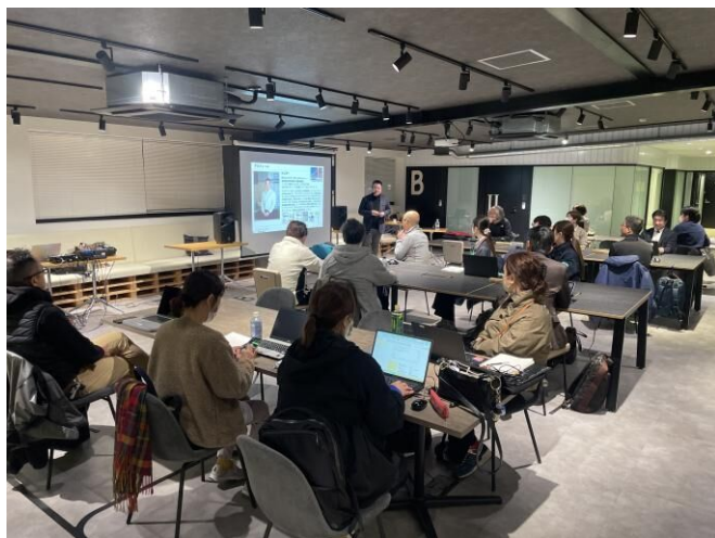
▲講義に参加された皆様

また、AIツールの提供形態について、チャット型、エージェント型など様々な形態があることやアプリの組み込み型というものまでさまざまなAIを知ることができました。