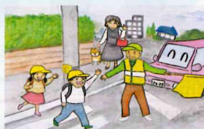
田中 優斗 (早良高校)