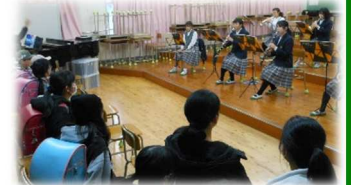
部活動見学の様子(吹奏楽部)

2月1日に6年生が中央中学校の入学説明会に参加しました。説明会では、中学校入学にあたっての心構えや生活の在り方、教科・学習内容等についてのお話がありました。温かな気持ちで入学を迎えてくれる雰囲気がたくさん見られ、南郷小学校と一緒に参加した本校の6年生は、入学への期待感や安心感をもったようでした。