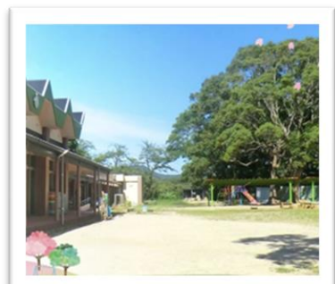
～福岡教育大学附属幼稚園～