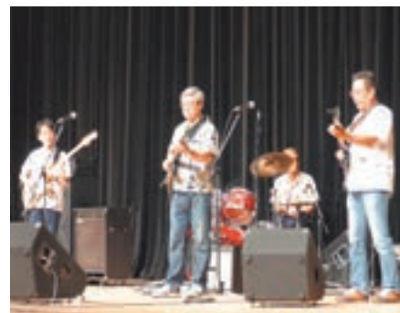
演奏を楽ししむ出演者のみなさん (イベントホールステージの様子)