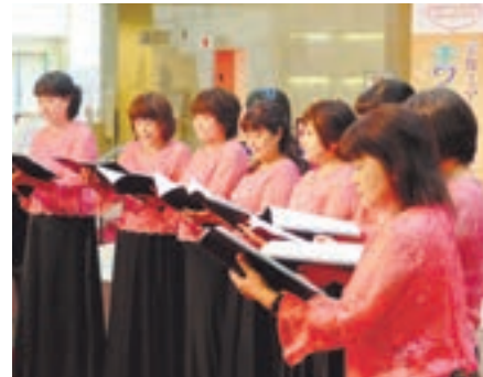
美しい歌声が響きます (ホワイエステージの様子)